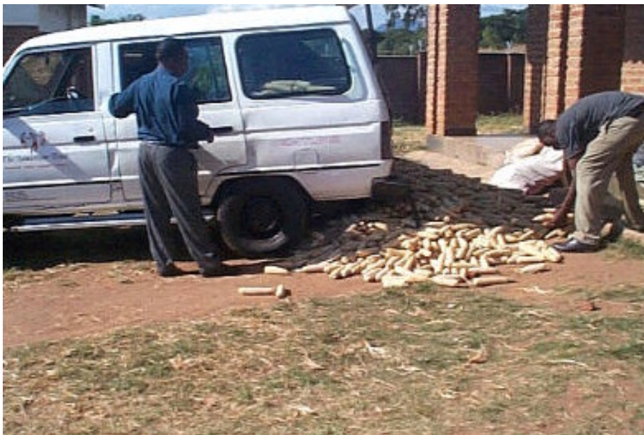
Foto: Samaritan Trust probeert zelf voedsel te produceren. Op deze foto brengt de TST-auto maiskolven die op van 15 April 2008 geoogst zijn.

Ook in Malawi wordt dit nagestreefd. Agora Limited, een plaatselijke organisatie op het gebied van landbouwhulpmiddelen, wist ook dat het eerste waar een straatkind behoefte aan heeft voedsel is. Met in het achterhoofd dat je geen vis moet geven maar moet leren vissen geven ze, naast een bijdrage in cash, ook een bijdrage in landbouwhulpmiddelen.